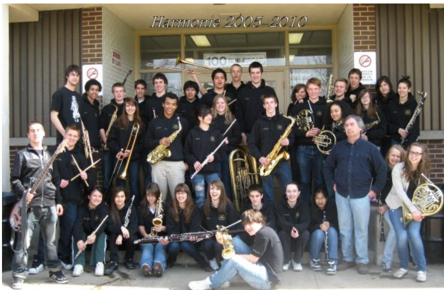
École secondaire Grande-Rivière

C'est une première, puisqu'aucune autre Harmonie de la région de l'Outaouais n'a osé participer à un tel concours (catégorie B Concentration) où s'affrontaient les ensembles musicaux faisant partie de « Musique-étude » ou encore des élèves de niveau collégial. L'école secondaire Grande-Rivière peut être fière de ses élèves qui ont toujours su se démarquer musicalement.