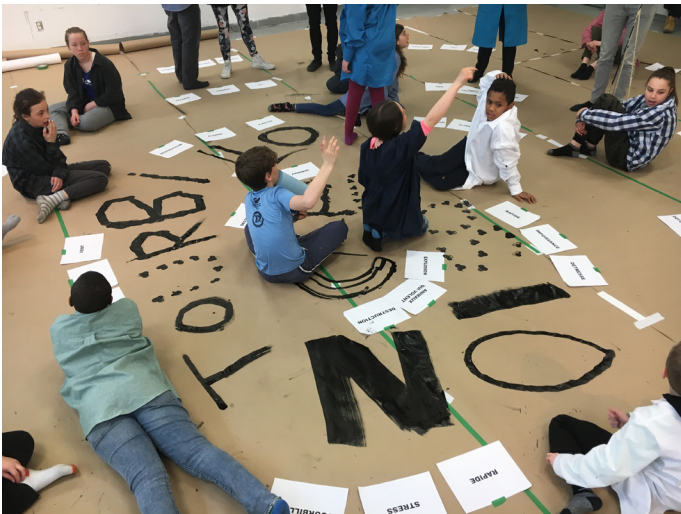
« Corps, encre, espace, puis le geste et les déplacements donneront sens au projet que nous dessinons. » (Eddy Terki, graphiste)